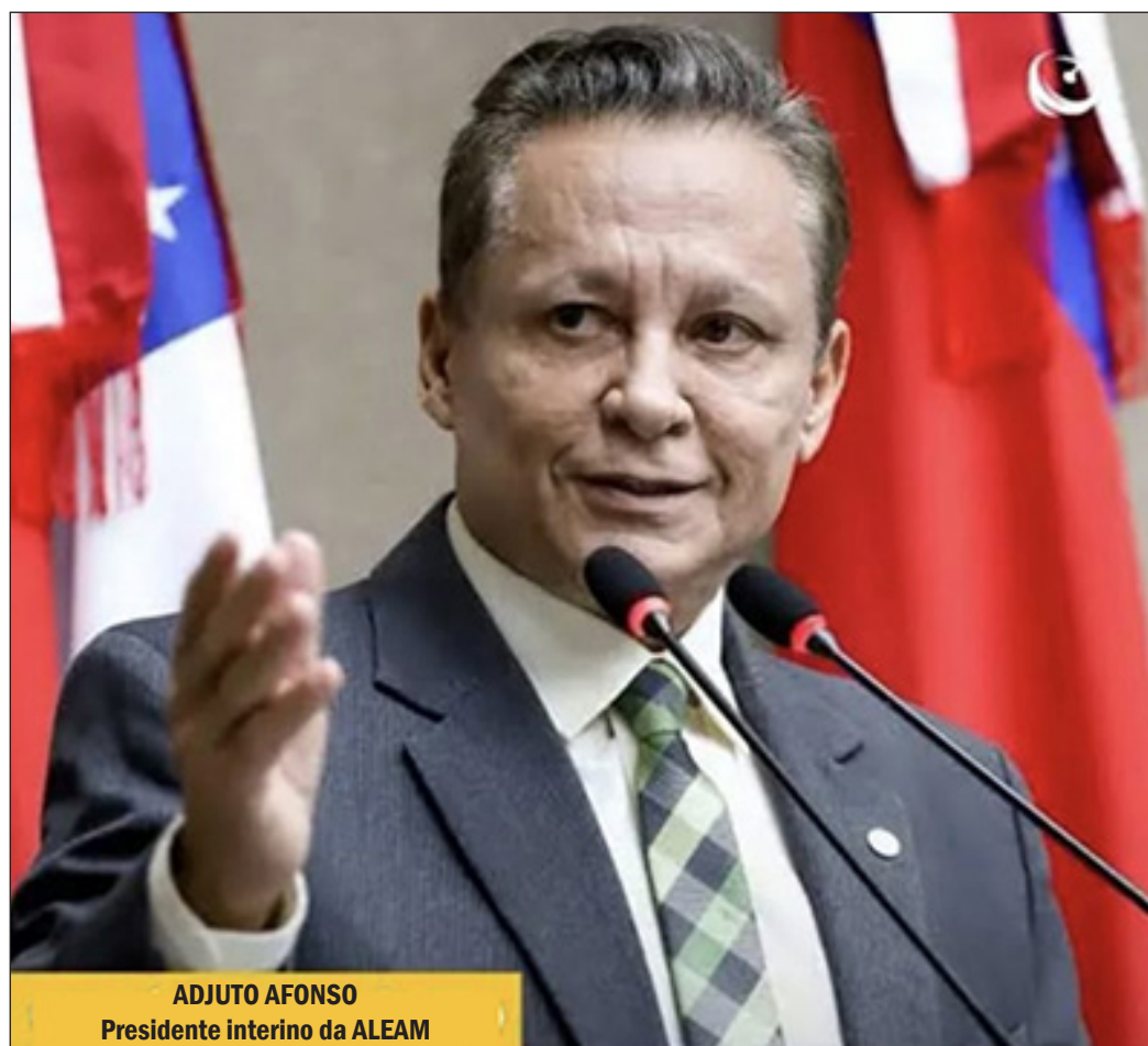
ADJUTO AFONSO Presidente interino da ALEAM

O processo ocorre após a vacância simultânea dos cargos no Executivo estadual e segue as regras definidas pela Lei nº 8.162/2026. Para vencer no primeiro turno, a chapa precisa alcançar maioria absoluta dos votos. Caso isso não ocorra, haverá segundo turno entre os dois mais votados, com decisão por maioria simples. O edi-