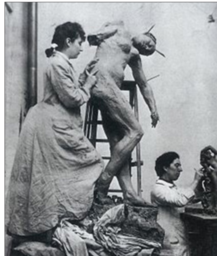
Camille Claudel em sua oficina (anterior a 1930)

e seu irmão tomaram o controle das finanças, deixando-a na miséria, usando roupas esfarrapadas e vivendo de favores.