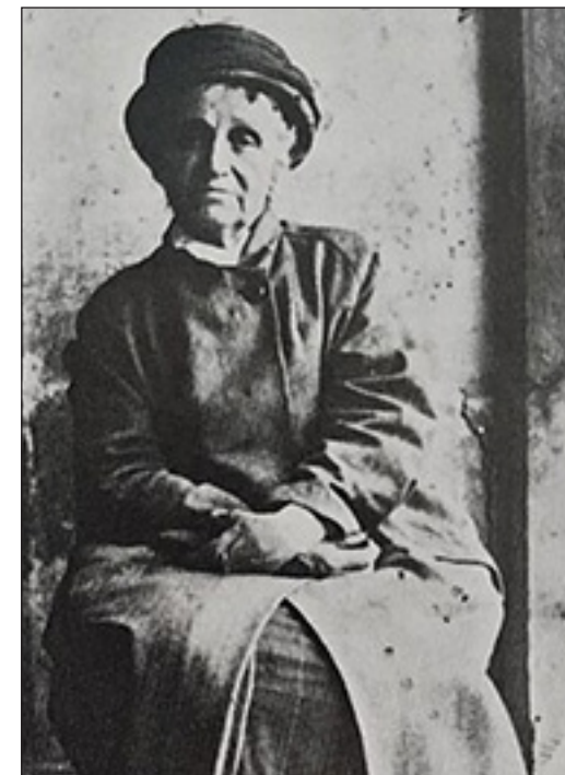
Camille Claudel já idosa

Camille Claudel faleceu em 19 de outubro de 1943, após viver 30 anos no hospício de Montfavet (hoje conhecido como Asilo de Montdevergues, um moderno centro hospitalar e psiquiátrico).