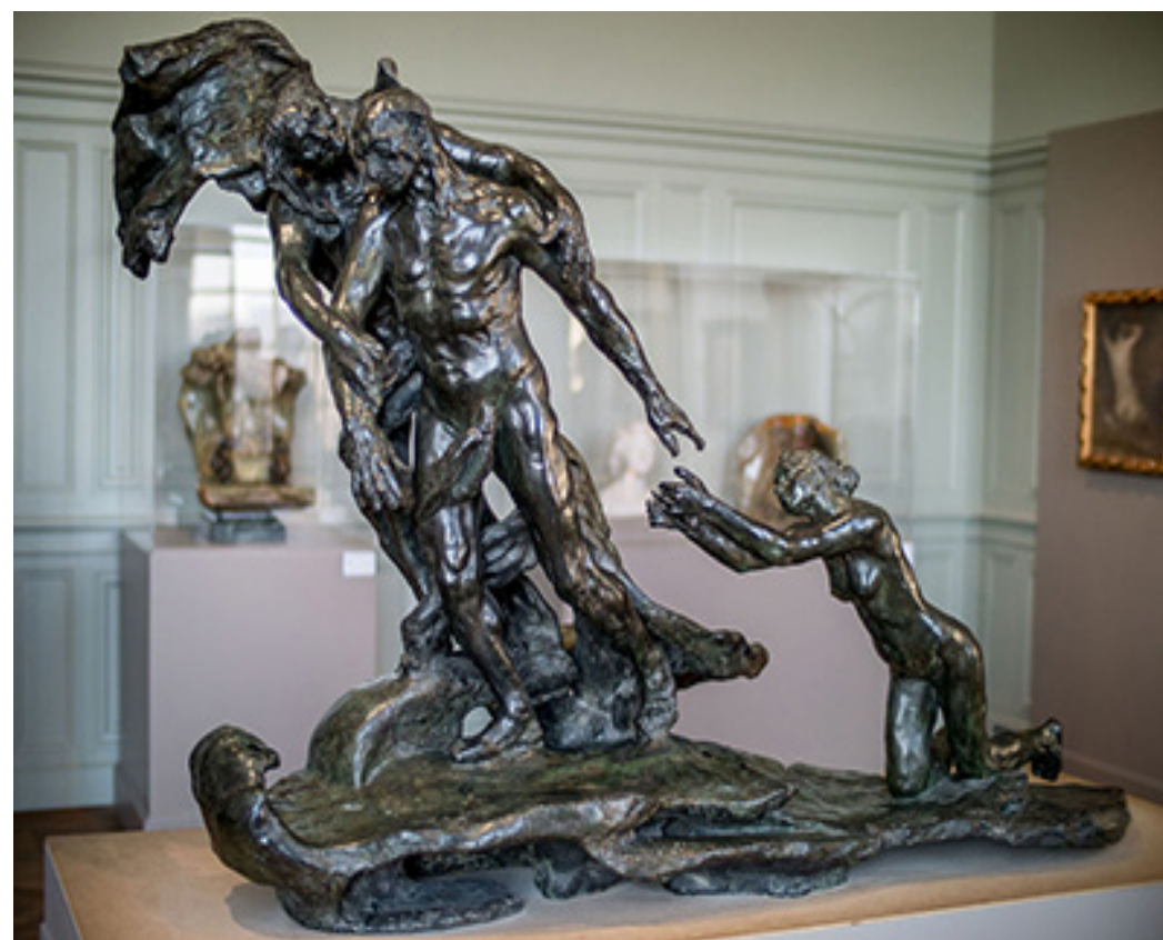
The Age of Maturity (entre 1898 e 1913)