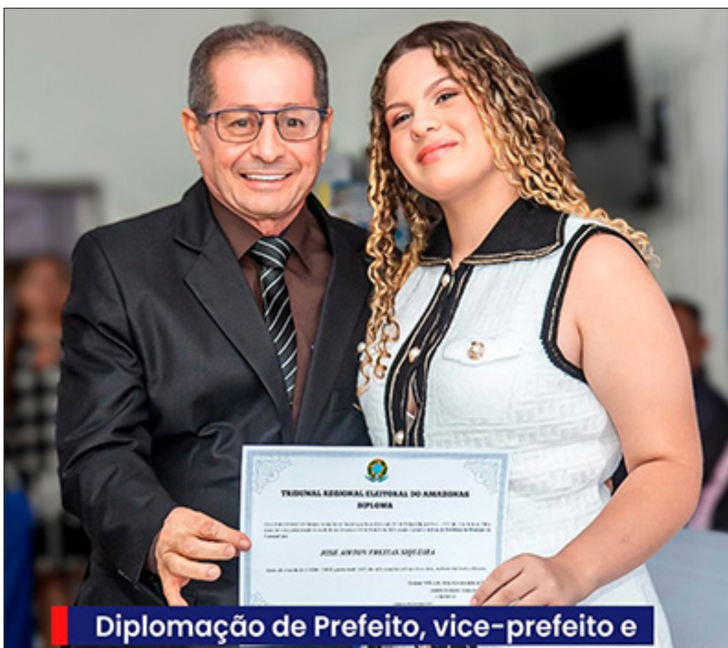
Diplomação de Prefeito, vice-prefeito e

A cidade fornece recursos naturais para Natura, de andiroba, por exemplo. Temos organizações que tem parcerias com a Natura na produção de matéria-prima para fazer perfumes. Carauari é protagonista nesses produtos, é reconhecido nacionalmente pela qualidade dos nossos produtos. Não só disso, mas no manejo do Pirarucu e também na produção de Açaí que é de excelente qualidade.