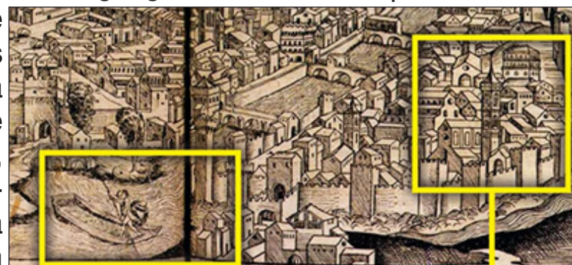
HOMEM MAIS ALTO DO QUE A CASA

No diálogo inventado por Lomazzo, Leonardo responde afirmativamente com entusiasmo. Em 1910, Sigmund Freud especulou que, apesar de cercar-se de jovens bonitos, a homossexualidade de Da Vinci era apenas latente e não era colocada em prática.