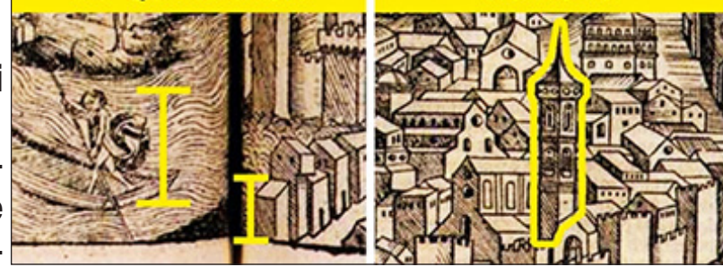
TORRE QUE BLOQUEIA AS RUAS