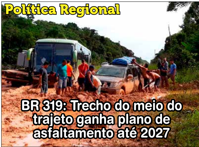
BR 319: Trecho do meio do trajeto ganha plano de asfaltamento até 2027