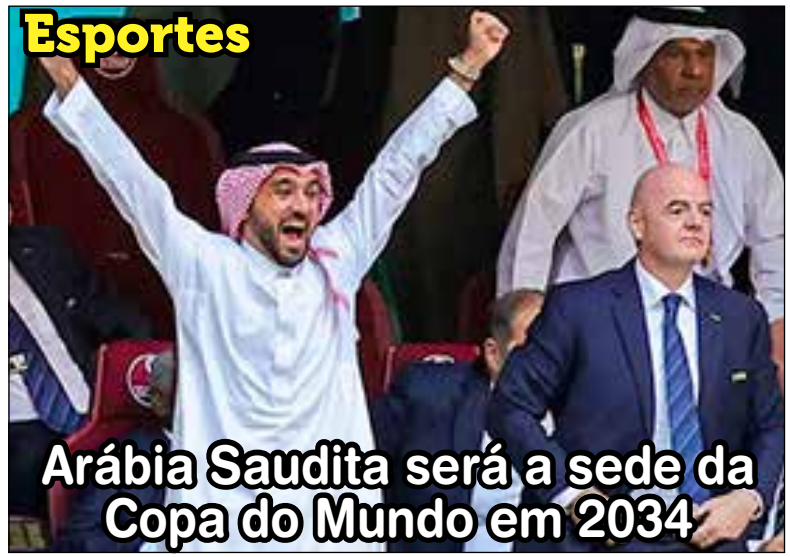
Arábia Saudita será a sede da Copa do Mundo em 2034