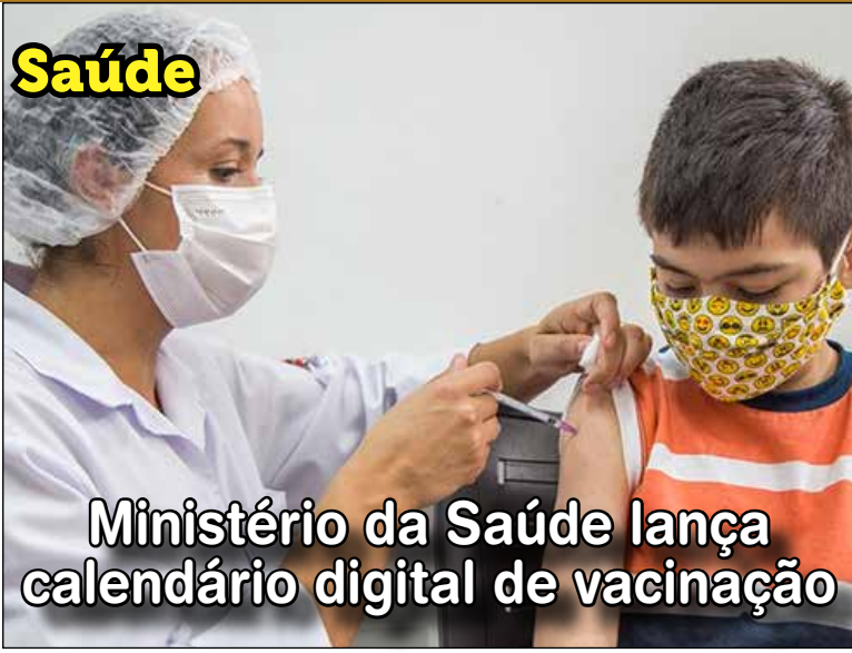
Ministério da Saúde lança calendário digital de vacinação