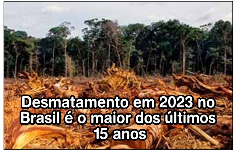
Desmatamento em 2023 no Brasil é o maior dos últimos 15 anos