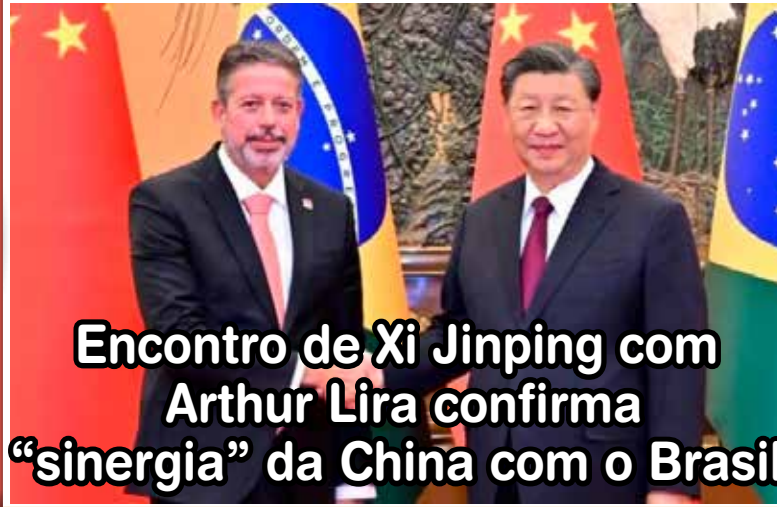
Encontro de Xi Jinping com Arthur Lira confirma "sinergia" da China com o Brasil