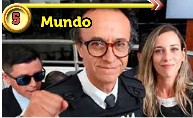
5 Mundo Partido Construye de Fernando Villavicencio anuncia novo candidato à presidência