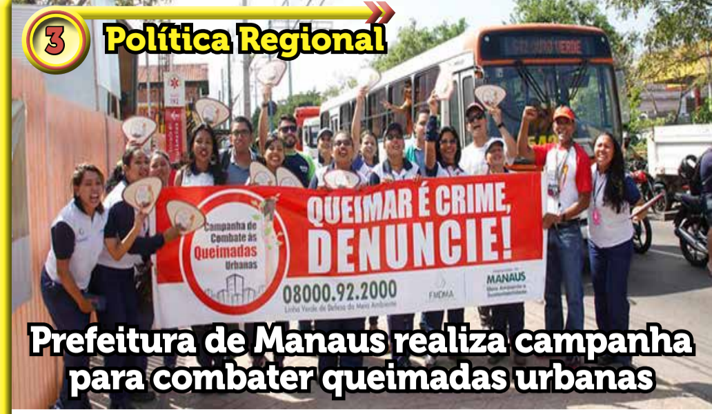
3 Política Regional Prefeitura de Manaus realiza campanha para combater queimadas urbanas