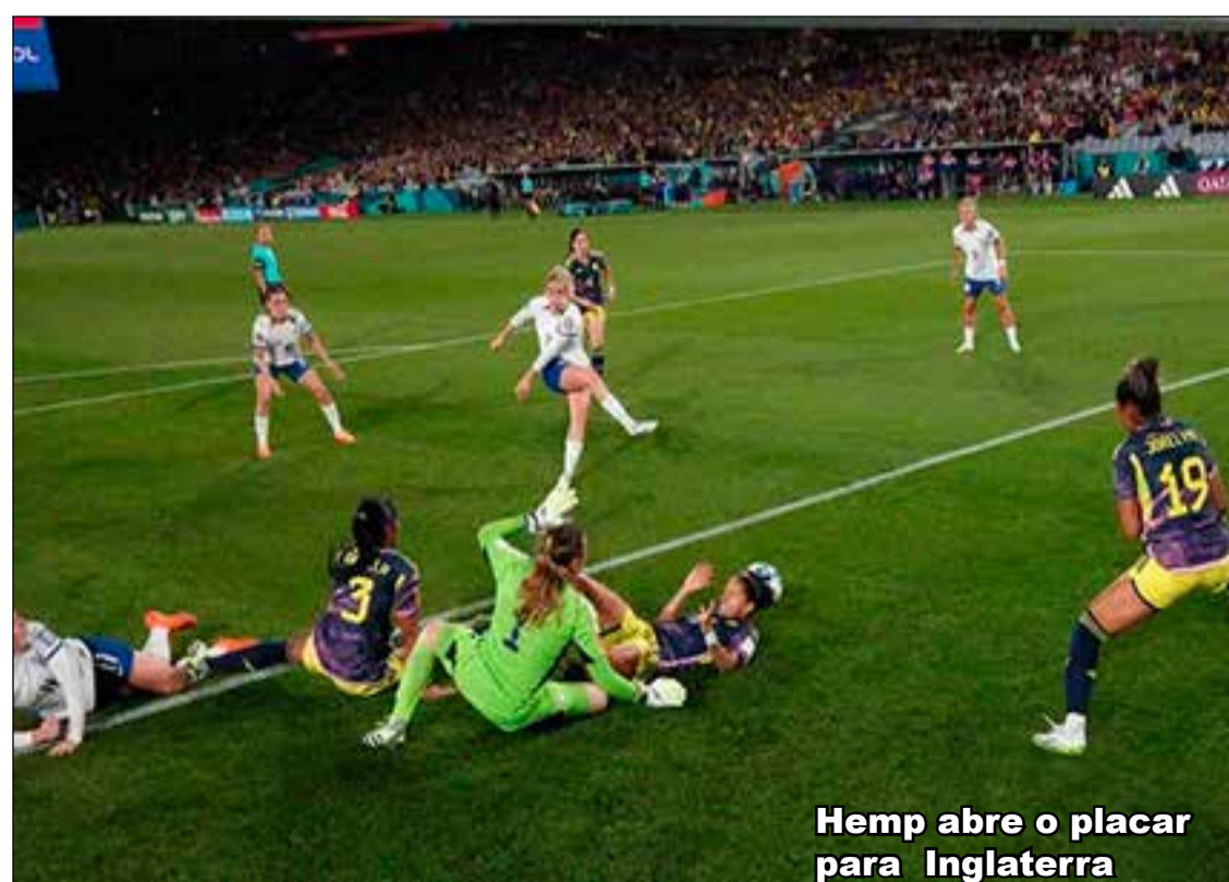
Hemp abre o placar para Inglaterra

Mary Earps nem sequer esperava o que estava por vir. Na beira do campo, Leicy Santos dançou para cima da marcação inglesa e mandou um chute para encobrir a goleira da Inglaterra. Abriu o placar para alimentar o sonho das colombianas e foi atropelada pelo abraço da companheiras.