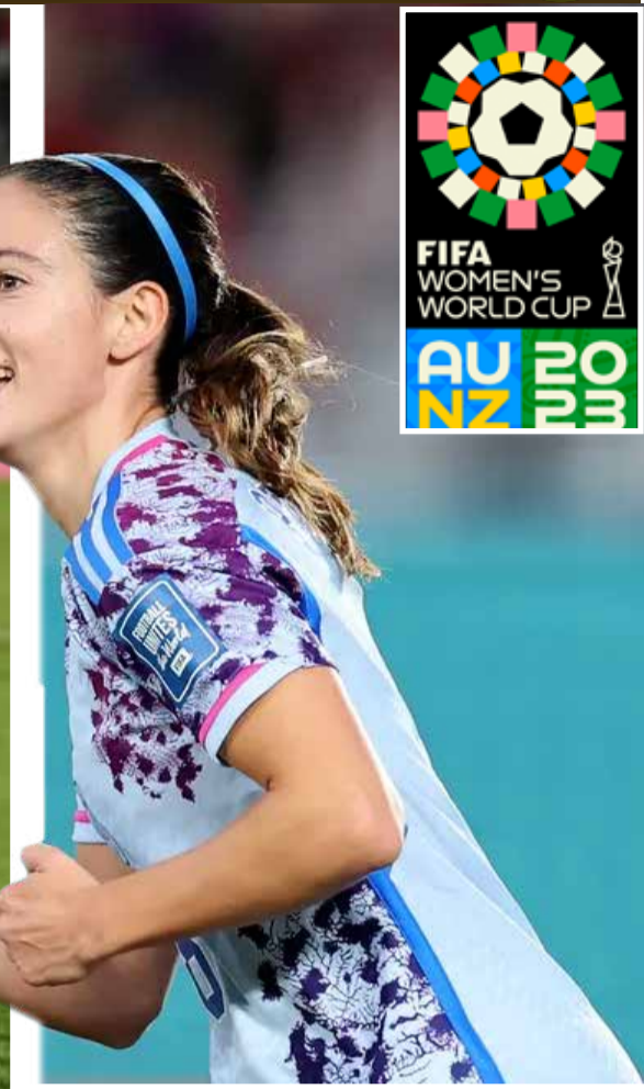
Aitana Bonmatí se destacou em goleada da Espanha sobre a Suíça fazendo dois gols