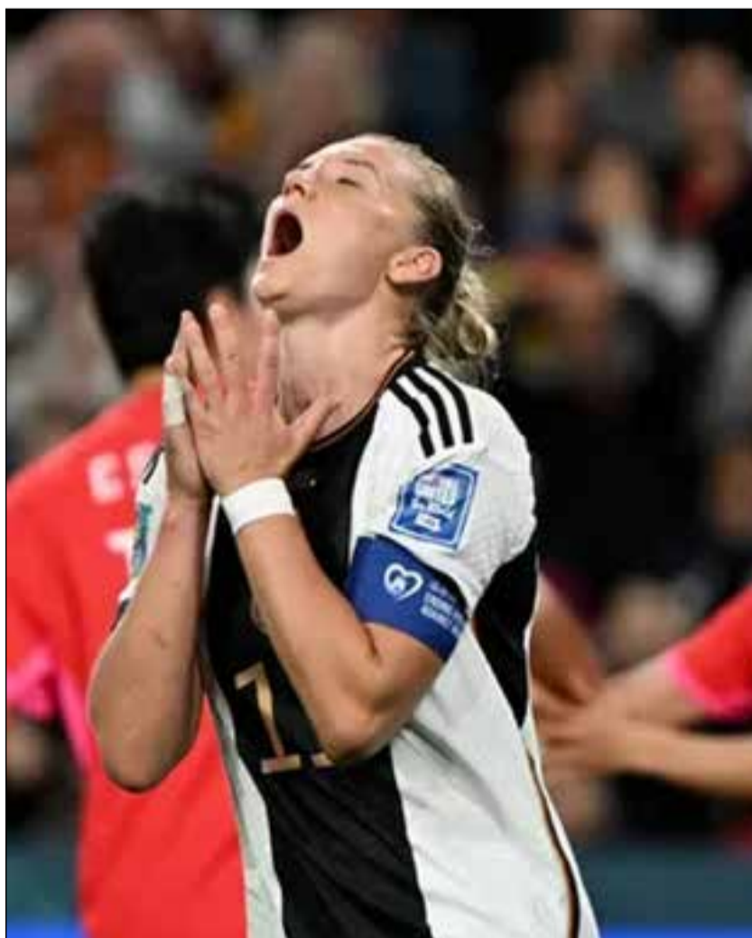
Popp fez o gol de empate da Alemanha