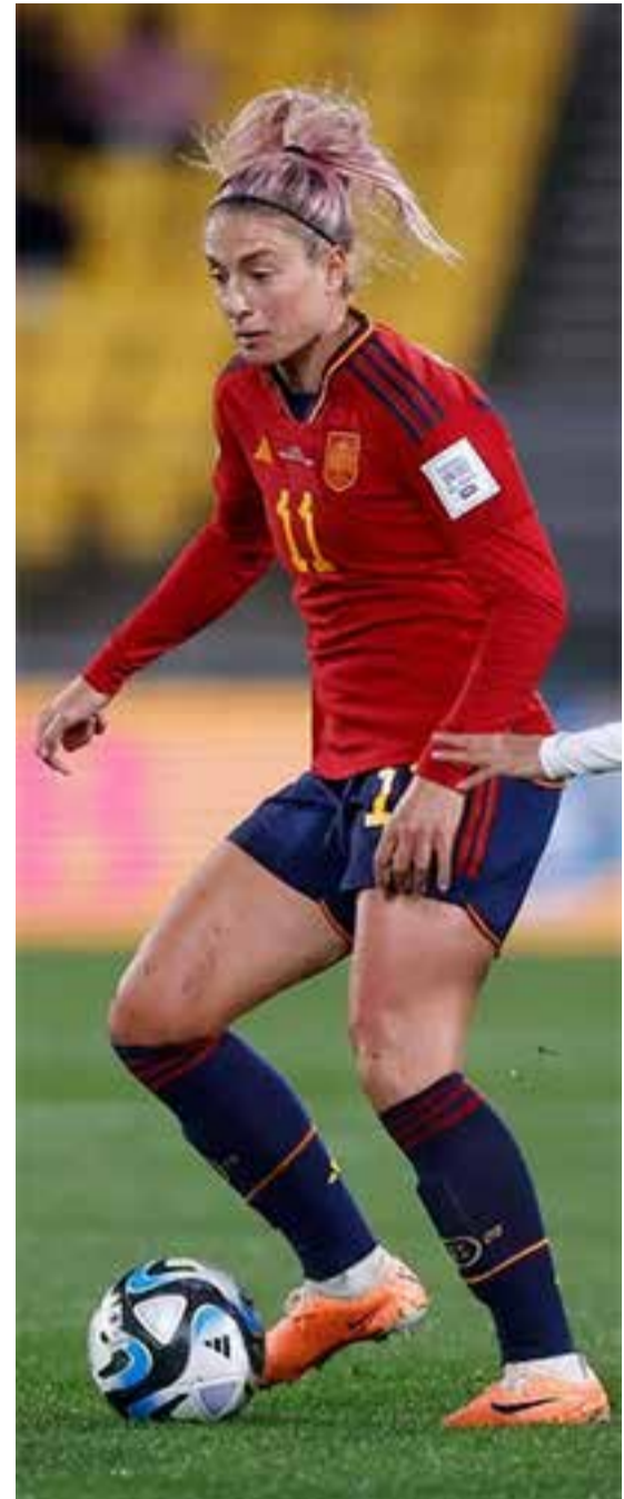
A espanhola Alexia Putellas, melhor jogadora do mundo, retorna aos gramados após grave lesão

cos minutos em que esteve em campo e mostrou que, caso atue em alto nível, a Espanha deve ir longe nessa Copa. Com o resultado, La Roja assume a primeira colocação do seu grupo.