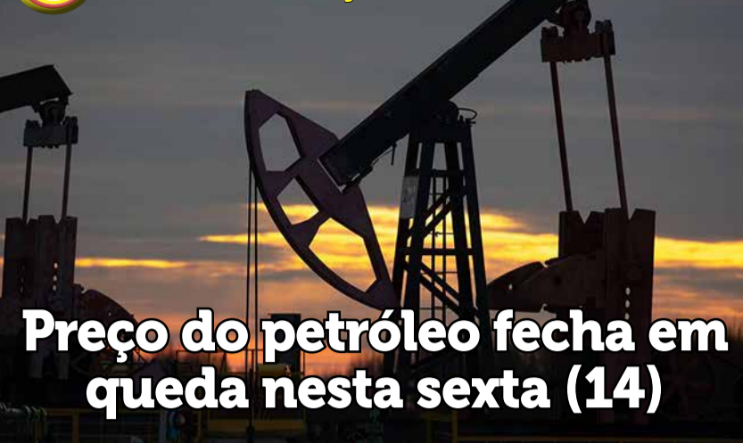
Preço do petróleo fecha em queda nesta sexta (14)