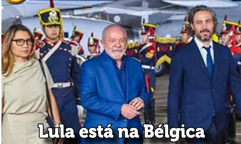
Lula está na Bélgica