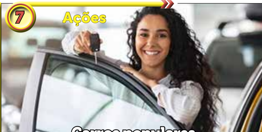
7 Ações Carros populares podem beneficiar grupo de ações na Bolsa; veja a lista de campeãs