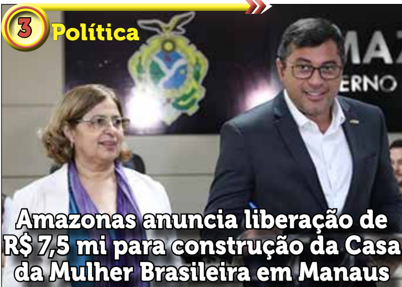
3 Política Amazonas anuncia liberação de R$ 7,5 mi para construção da Casa da Mulher Brasileira em Manaus