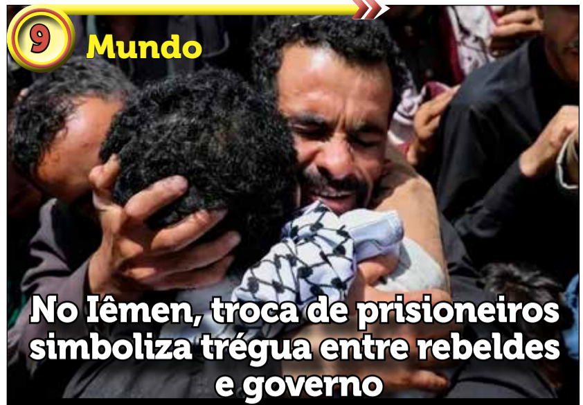
9 Mundo No Iêmen, troca de prisioneiros simboliza trégua entre rebeldes e governo