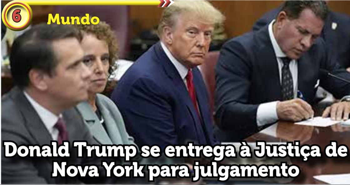
Donald Trump se entrega à Justiça de Nova York para julgamento