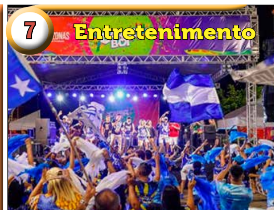
7 Entretenimento Carnaboi em Manaus com previsão de chuva forte