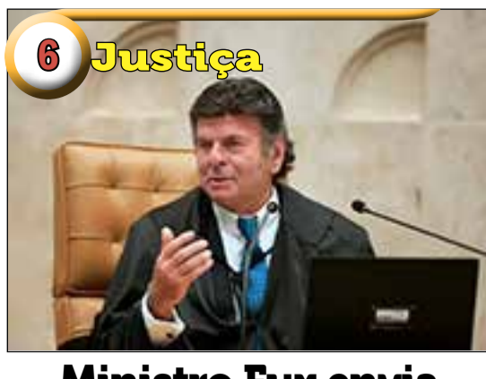
6 Justiça Ministro Fux envia pedido de investigação à Justiça do DF contra Bolsonaro