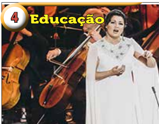
4 Educação Projeto Ópera Studio, da Esat/UEA, está com inscrições abertas