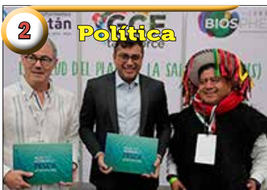
2 Política No México, Wilson Lima divulga oportunidades de negócios no Amazonas em bioeconomia