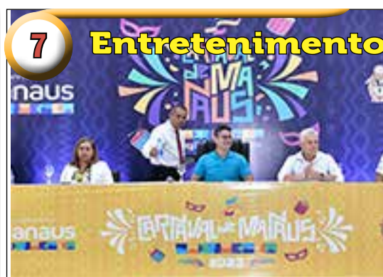
7 Entretenimento Prefeitura anuncia investimentos de mais de R$ 6 milhões para Carnaval de Manaus 2023