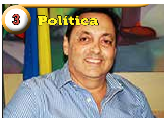
3 Política Prisão de político paraense revela rota do ouro ilegal na Amazônia