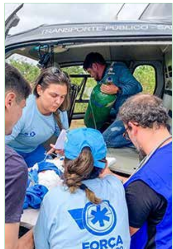
Lula levou equipe do Ministério da Saúde para avaliar e dar os primeiros atendimentos com traslados de pacientes