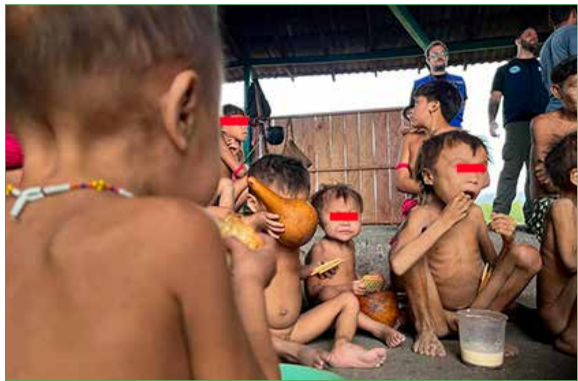
Sem nada para comer as crianças sofrem mais com a desnutrição