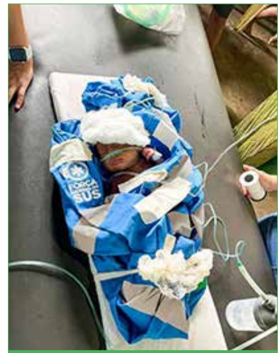
Inúmeros bebês com quadro grave de saúde receberam atendimento