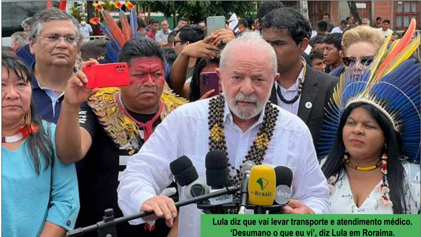
Lula diz que vai levar transporte e atendimento médico. ‘Desumano o que eu vi’, diz Lula em Roraima.

Ao tomar conhecimento da situação precária e