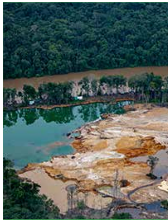
O garimpo ilegal contribui para o sofrimento dos Yanomamis

"Vamos fazer cumprir a lei em relação aos sofrimentos criminosos impostos aos Yanomami. Há fortes indícios de crime de genocídio, que será apurado pela PF," disse o ministro Flávio Dino.