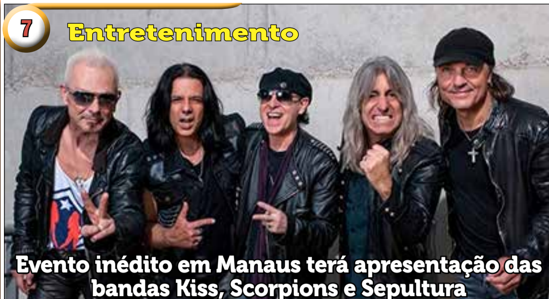
Evento inédito em Manaus terá apresentação das bandas Kiss, Scorpions e Sepultura