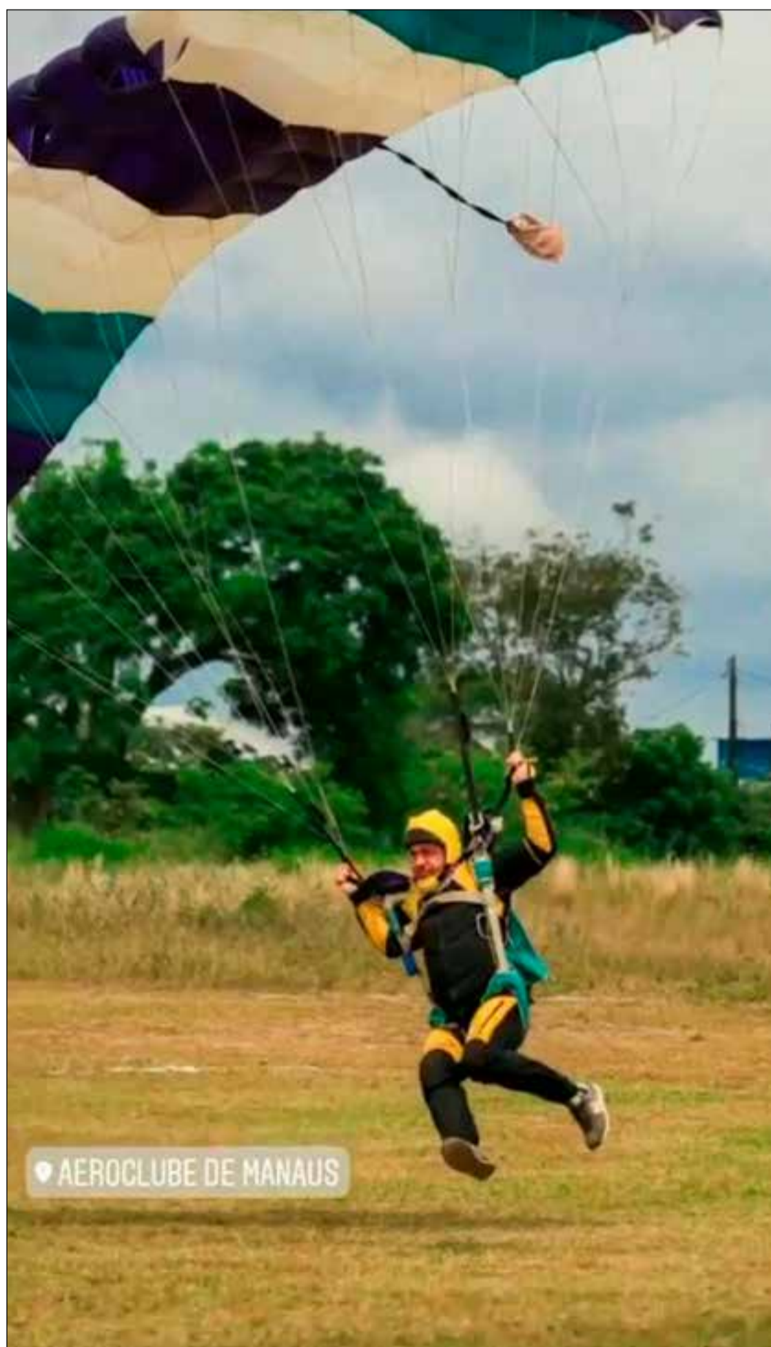
AERoclube de MANAUS

Até porque também nessa data comemoramos o nosso dia da segurança no esporte nacional, por isso além de saltar pra comemorar esse dia, também abordamos esses assuntos.