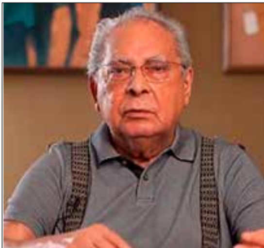
Amazonino Mendes (CIDADANIA)