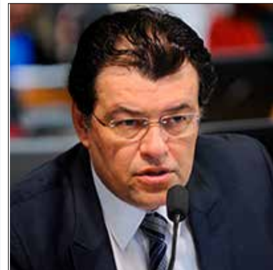
Eduardo Braga (MDB)