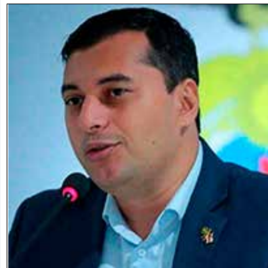
Wilson Lima (UNIÃO BRASIL)